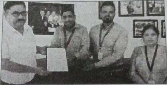
ದಾವಣಗೆರೆಯ ಬಿಇಇಟಿ ಕಾಲೇಜು ಐಸಿಟಿ ಕಂಪನಿಯೊಂದಿಗೆ ಅಸೋಸಿಯೇಟ್ ಸದಸ್ಯತ್ವ ಒಪ್ಪಂದ ಮಾಡಿಕೊಂಡಿತು.